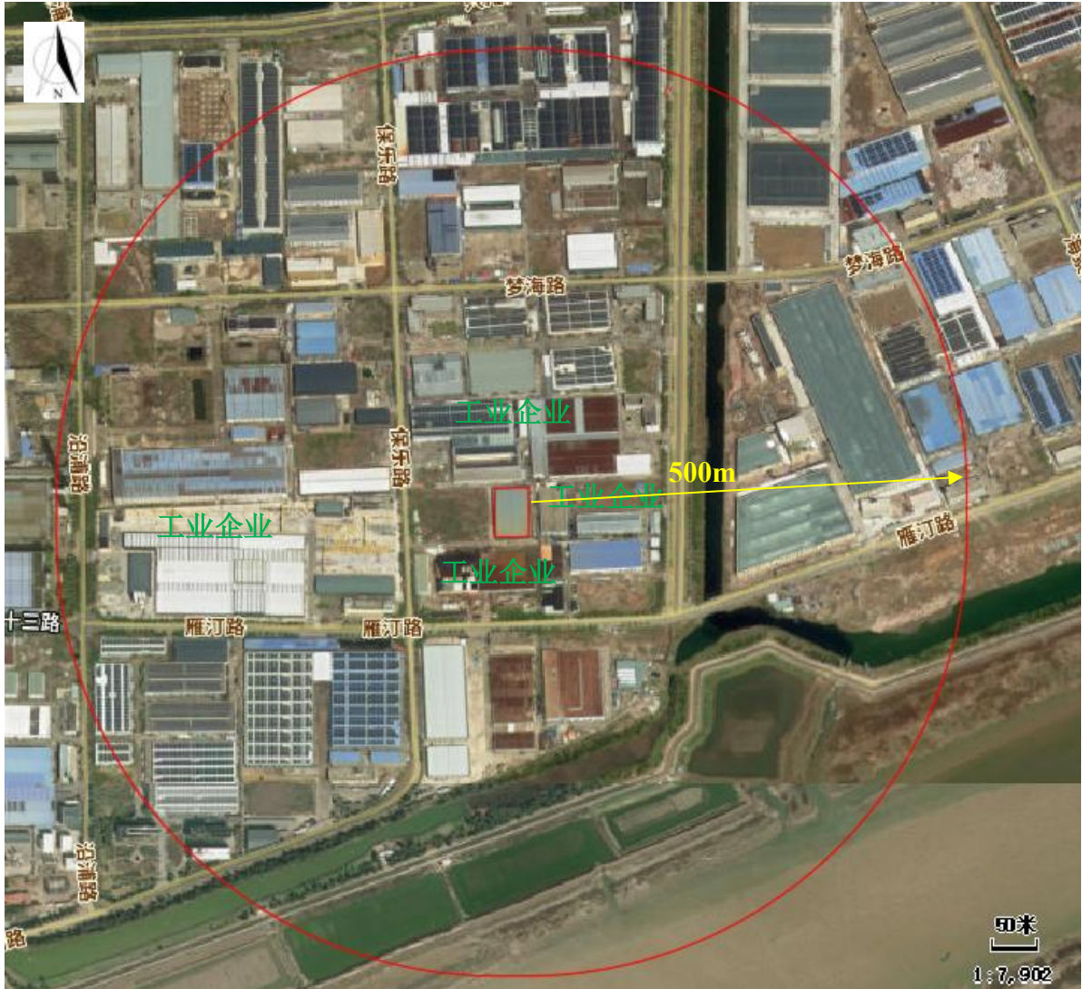
图 4-1 厂区周边环境图

本项目周边 500m 范围内不存在现状及规划的大气环境保护目标, 周边分布见下图。